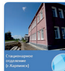
Стационарное отделение (г. Карпинск)