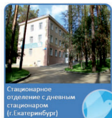
Стационарное отделение с дневным стационаром (г. Екатеринбург)