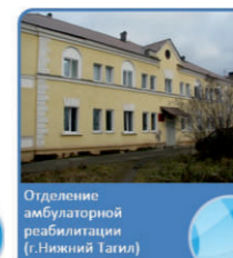
Отделение амбулаторной реабилитации (г. Нижний Тагил)