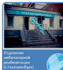
Отделение амбулаторной реабилитации (г. Екатеринбург)