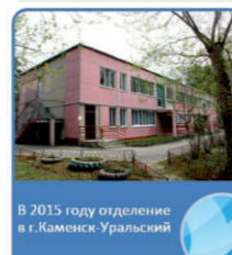
В 2015 году отделение в г. Каменске-Уральском